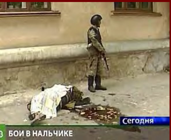
БОИ В НАЛЬЧИКЕ