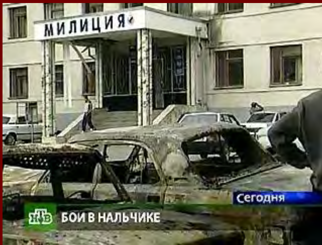
БОИ В НАЛЬЧИКЕ